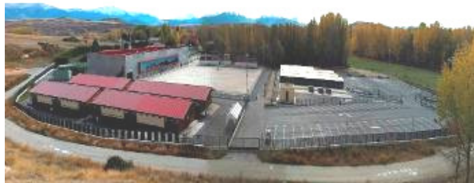
PANORAMICA DEL CENTRO ECUESTRE DE CASTILLA Y LEON.

Hoja de inscripción y normas en www.cescale.es