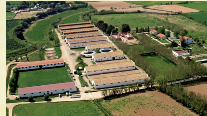
Vista aérea del Centro Militar de Cría Caballar de Zaragoza