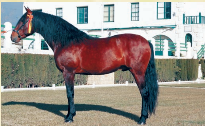
Reno II (PRE)

* Estos precios podrán verse modificados según posterior publicación de los mismos en BOE